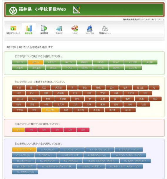
集計結果選択画面